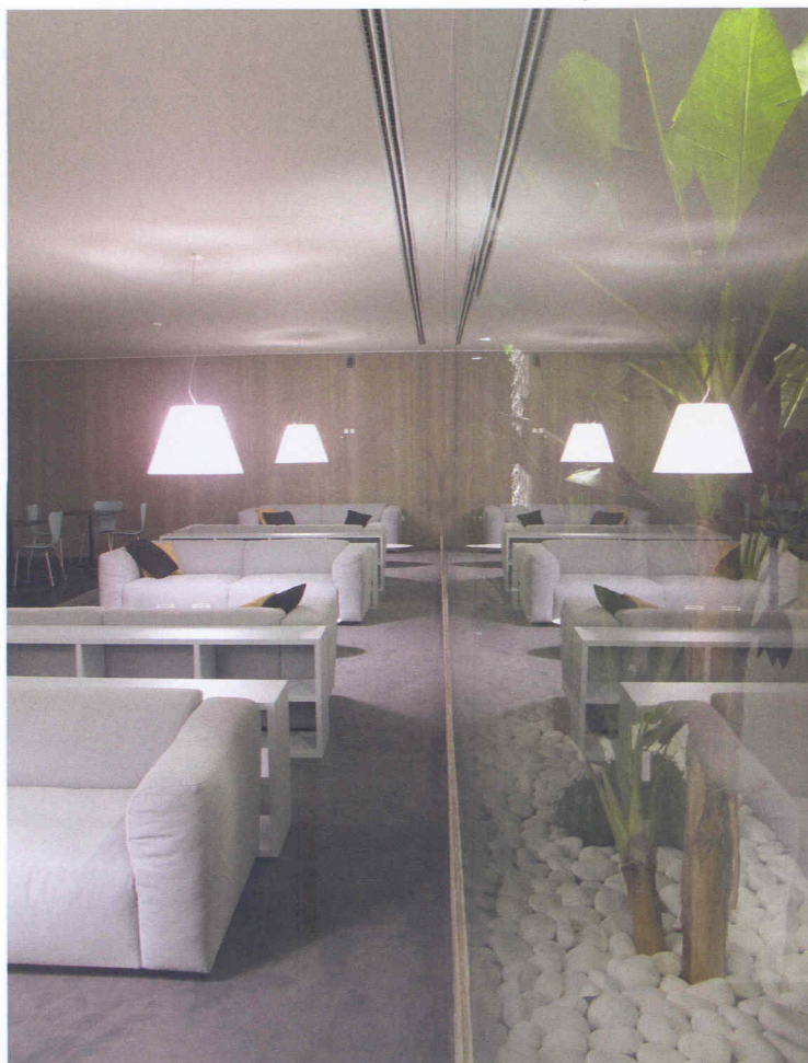
SALA DAS FAMÍLIAS, ESTÁDIO DO DRAGÃO, PORTO: Duas perspectivas com jardim de Inverno, sofás MDF Itália e cadeiras '07' Fritz Hansen.