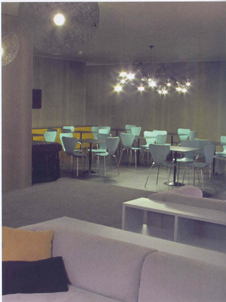
FAMILY ROOM, DRAGÃO STADIUM, OPORTO: Two perspectives with winter garden, MDF Itália sofas and Fritz Hansen '07' chairs.